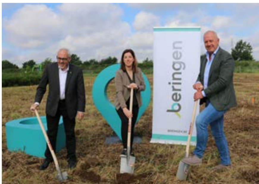
Eerste spadesteek voor het skatepark

De bouwwerken zijn gestart in juni. De opening van het park is gepland in oktober.