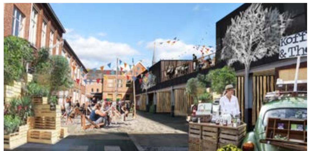
Toekomstbeeld van Lutgart