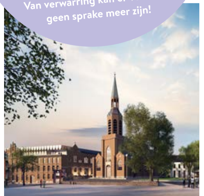
Zicht op de markt met links het nieuwe stadhuis

De voorbereidende werken voor de heraanleg van de Markt gaan dit najaar van start. De oplevering is gepland voor de zomer van 2021. De grondwerken voor de bouw van het nieuwe stadhuis zijn reeds gestart. De gevelreiniging van de kapel en de werkzaamheden aan het dak starten deze zomer.