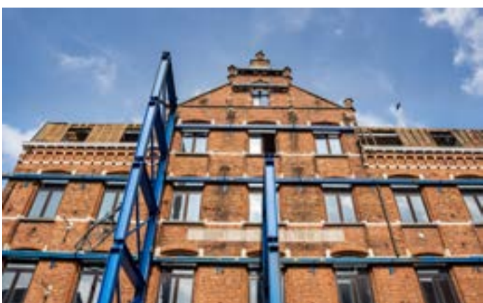
Het nieuwe stadhuis staat reeds in de stellingen

Centraal in het centrum is het oude collegegebouw de perfecte plaats voor het nieuwe stadhuis. Het ontwerp bewaart de karakteristieke voorgevel en de vleugel met kapel en toneelzaal. De nieuwe toegang komt op de hoek van de Collegestraat en de Markt, waar een opvallende insnijding in de gevel wordt gemaakt. Ook de Markt wordt volledig opnieuw aangelegd op maat van voetgangers en fietsers.