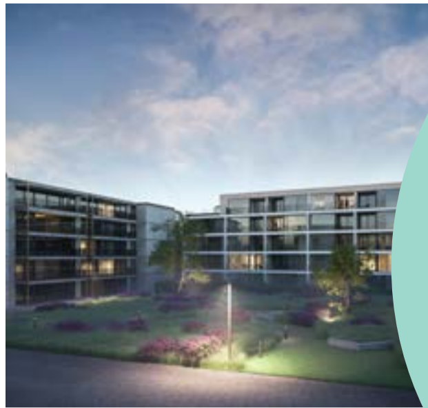
Twee woonvolumes met doorzonappartementen aan de Graaf van Loonstraat

In een eerste fase worden er rioleringswerken uitgevoerd in het noordelijk deel van de Graaf van Loonstraat. Deze werken starten net voor of na het bouwverlof.